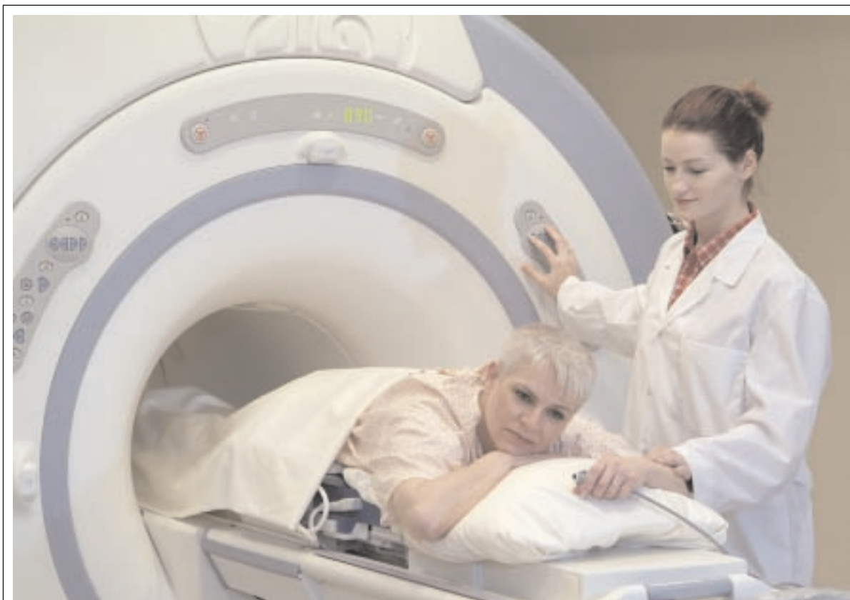
Für eine Behandlung von Uterusmyomen positionierte Patientin (Zerstörung des Fibroms durch Ultraschall, ohne Einschnitt).

Erforschung von Lebertumoren, und zwar aus zwei Gründen: erstens bewegt sich die Leber, wenn wir atmen, und zweitens befindet sich ein grosser Teil der Leber unterhalb der Rippen und ist somit schwer zugänglich. Wir haben bereits Lösungen gefunden und mit der Behandlung von ersten Patienten angefangen. Unser zweites wichtiges Forschungsgebiet befasst sich mit den Knochentumoren. Wie Sie sicher wissen, entwickeln viele Menschen mit Krebserkrankungen der Organe Knochenmetastasen. Diese extrem schmerzhaften Tumore werden heute zum Teil mit Hilfe von Bestrahlungen behandelt, obwohl dieses Verfahren eine Reihe von Nachteilen aufweist. Wir setzen uns demnach heute besonders für die Bekämpfung dieser Tumore ein, doch wir forschen auch im Bereich anderer Knochentumore. Unsere weiteren Forschungsschwerpunkte sind im Moment die Brust-Fibroadenome (in mehreren medizinischen Zentren weltweit werden gegenwärtig fortgeschrittene klinische Versuche durchgeführt), die benigne Hyperplasie der Prostata und Leberhämangiome. Auch für die operative Entfernung bösartiger Tumore an Brust, Leber, Nieren, Schilddrüse, Bauchspeicheldrüse und Prostata sind klinische Tests im Gange. Tumore an Dickdarm und Lunge stellen ein grosses Problem für uns dar, denn der Ultraschall durchdringt die Gase nicht und ich bin nicht sicher, ob es uns gelingen wird, diese Erkrankungen irgendwann