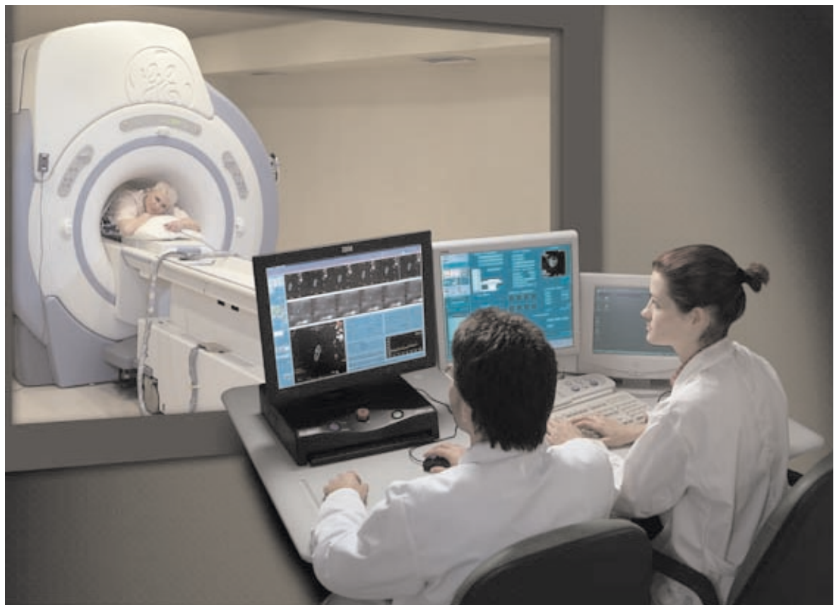
Umfassender Blick auf den Patienten und auf den Kontrollraum, wo sich die Bildschirme für die Behandlung befinden.

In ihrer Ausgabe vom 19.-26. August 2002 veröffentlichte Business Week die 25 Ideen, welche die medizinische Welt nachhaltig prägen würden. Der Untertitel dieser Serie lautete «Die neuen Behandlungsmethoden sollen weniger invasiv, kürzer, kostengünstiger und effizienter werden». Auf dem 21. Platz wurde die israelische Erfindung beschrieben: «In der Welt der medizinischen Forschung heisst einer der Schlüsselbegriffe minimally invasive therapies ». Dieses Konzept umfasst eine weite Palette von Technologien, zu denen auch die hoch auflösende Bildgebung, die Robotertechnik, Miniatursensoren (siehe SHALOM Nr. 36 zum Thema Given Imaging), Hochleistungs-Schallwellen, die Manipulation von Stammzellen usw. gehören. Ziel dieser Forschungsarbeiten ist es, chirurgische Eingriffe durch Techniken zu ersetzen, in denen Einschnitte völlig überflüssig sind. Um Genaueres über dieses «merkwürdige Gerät» zu erfahren, das allmählich die meisten Hysterektomien und Absetzungen der Brustdrüse ersetzen soll, haben wir ein Gespräch mit Dr. DOV MAOR geführt, einem Wissenschaftler und Forscher bei InSightec, der israelischen Gesellschaft, die ExAblate 2000 erfunden hat und es weiterentwickelt.